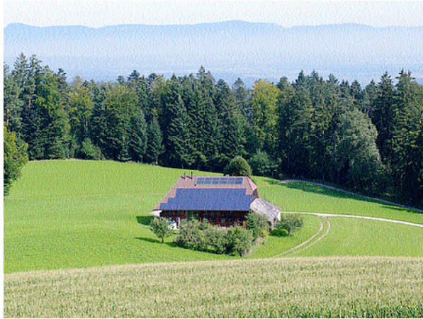
Anwesen Grunder, Bantigenhubel